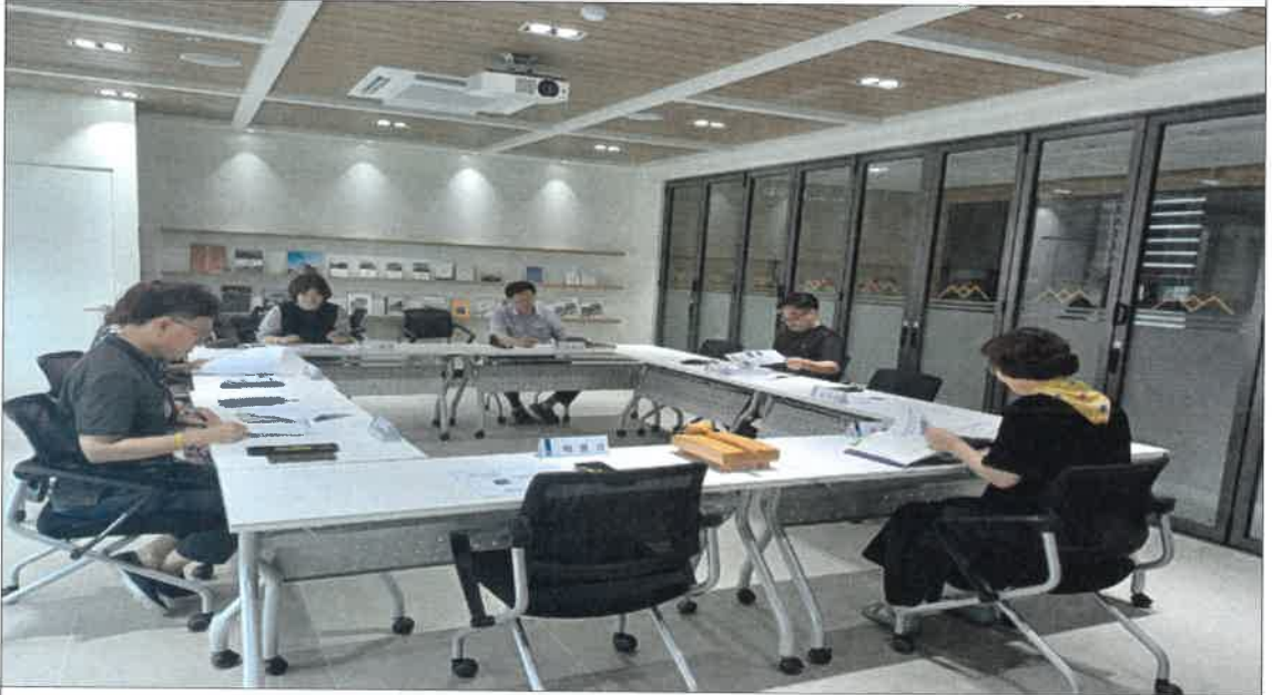
▲ 회의 모습