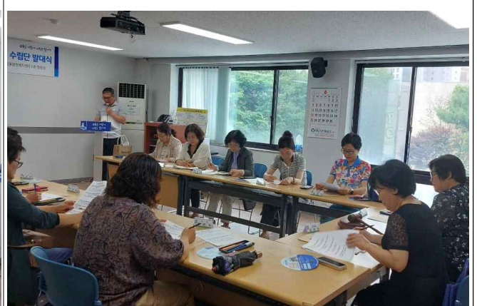
마을복지계획 수립단 발대식