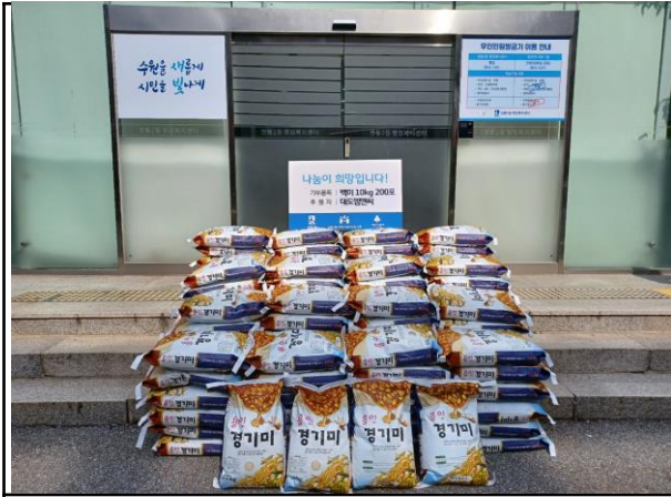
대도엠앤씨 백미 후원 (60만원 상당)