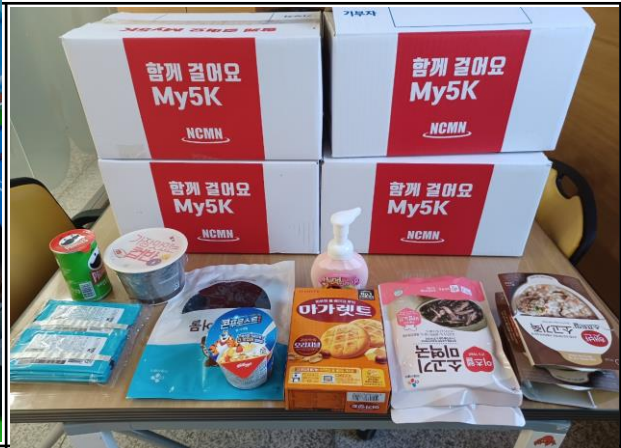
NCMN 사랑의 희망 상자(식품류 박스)