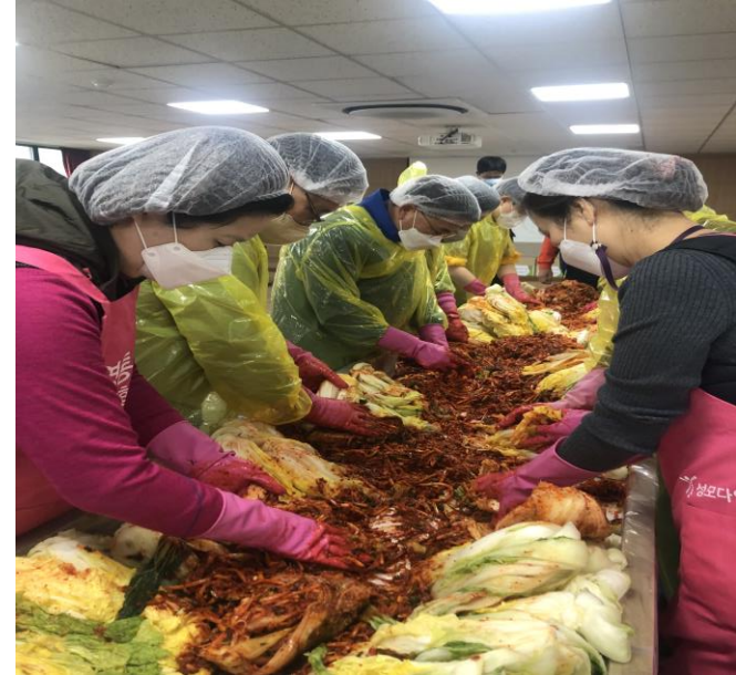
[참고] 2022년 김장 담그기 행사