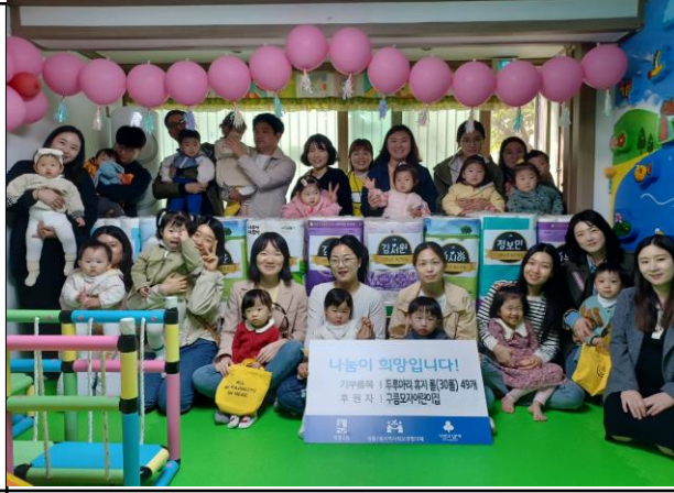
구름모자어린이집 두루마리 휴지 30롤 49개 (50만원 상당)