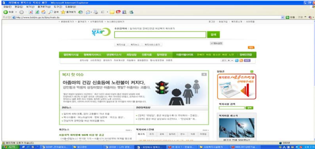
[그림 1] 복지포털 메인화면(8.12 현재)