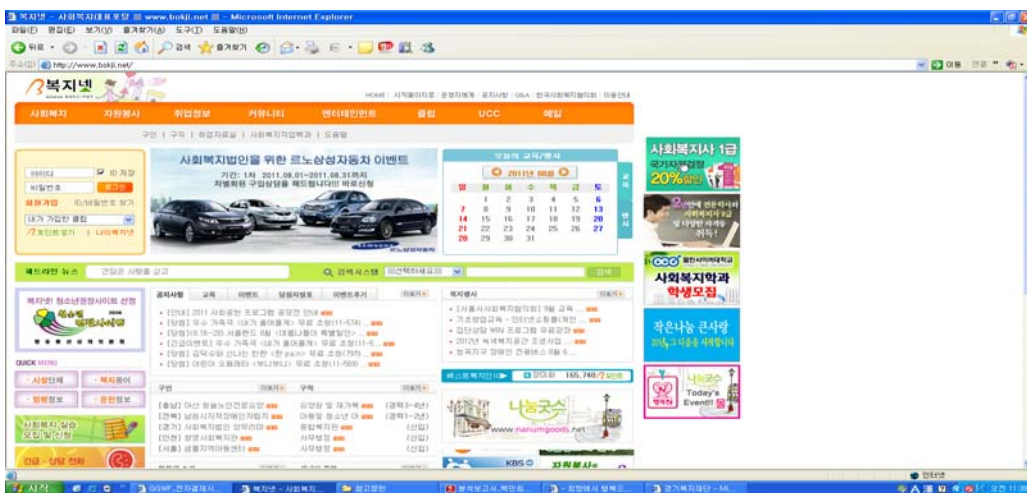
[그림 2] 복지넷 메인화면(8.12 현재)