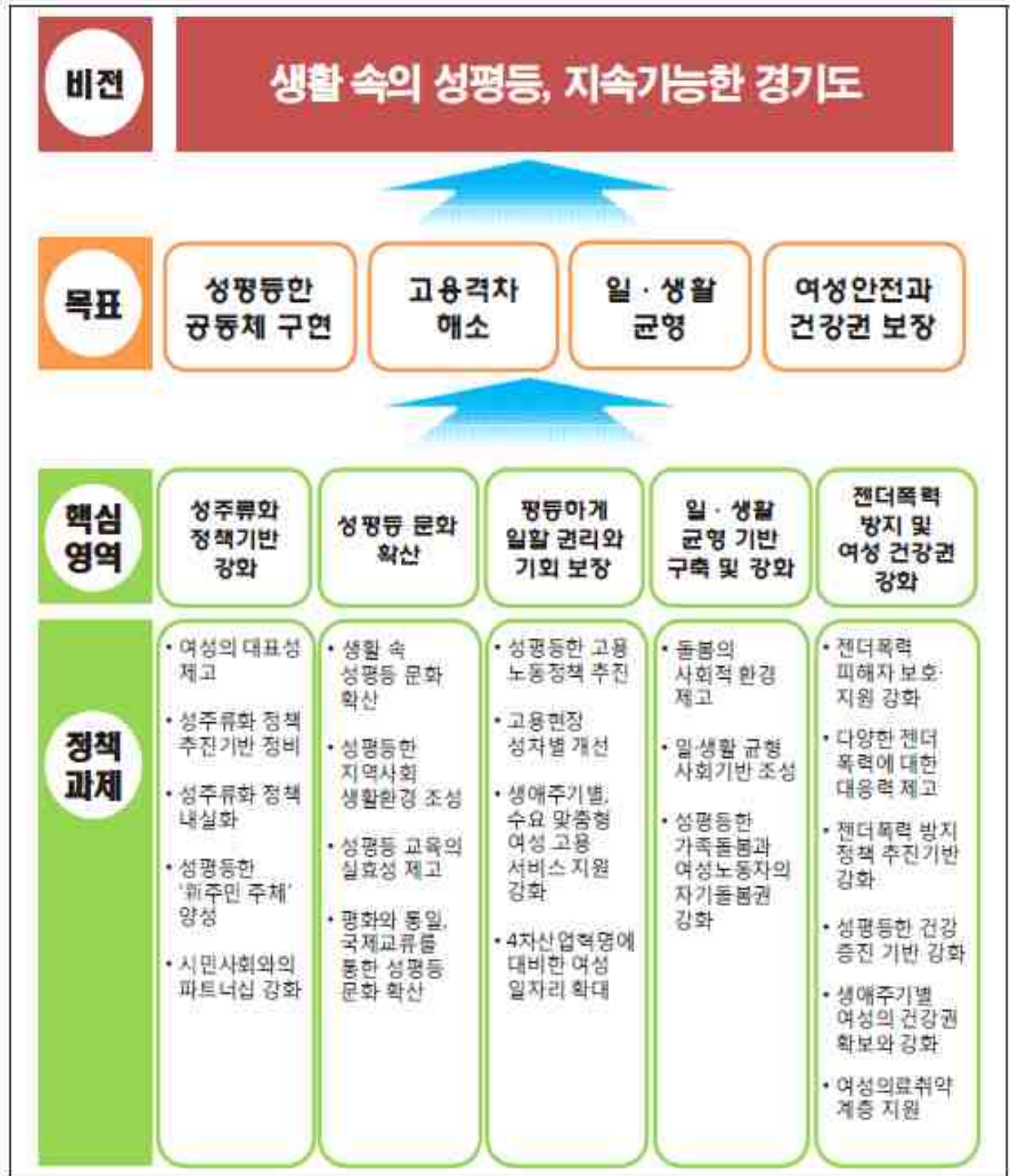
<참고자료 1> 경기도 양성평등기본 계획(안)의 비전과 목표