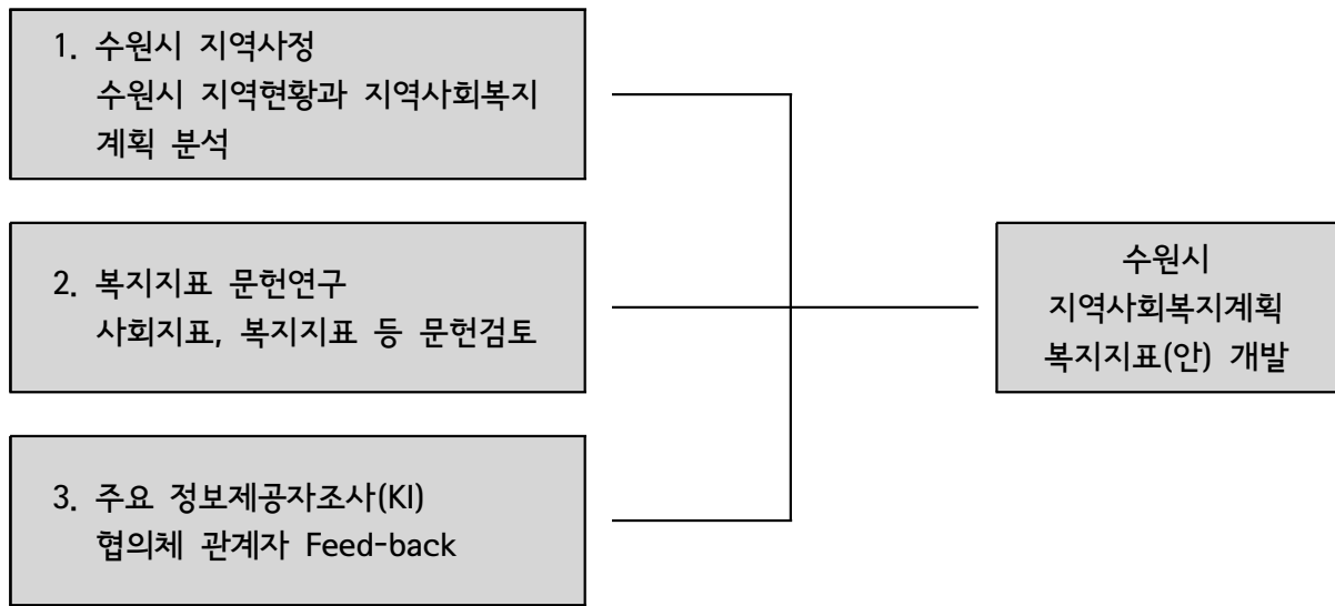
(그림 1-1) 연구내용 구성체계